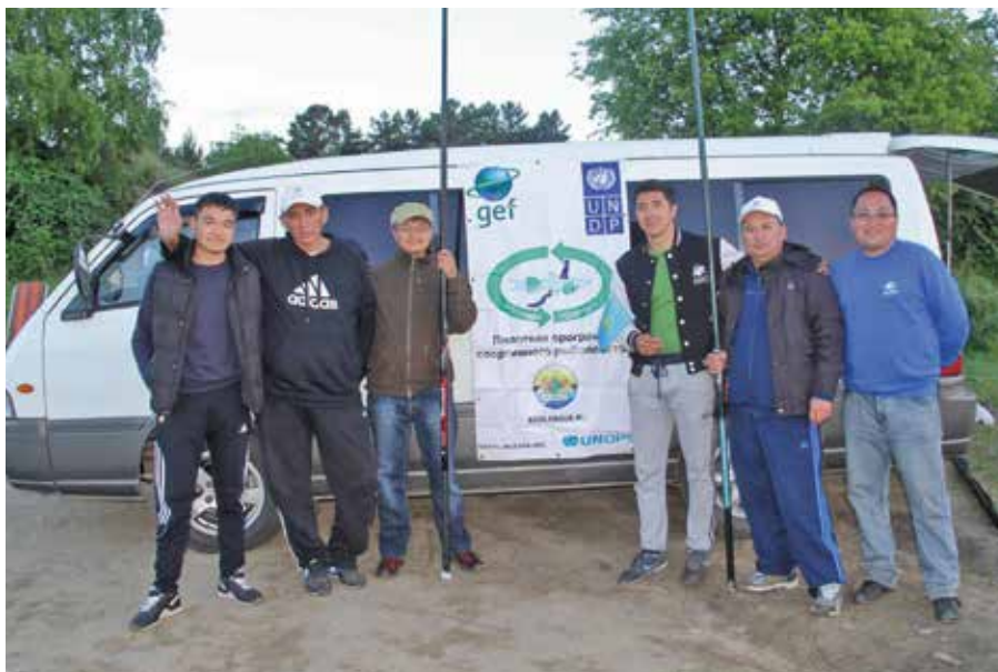
Пилотная программа спортивного рыболовства со студентами Евразийского университета им. Л.Н. Гумилева (г. Астана, Казахстан)

Проект ГЭФ/ПРООН — Разработка совместно с монгольскими соисполнителями на английском и русском языках концепции трансграничной сети НКО «Друзья бассейна Байкала».