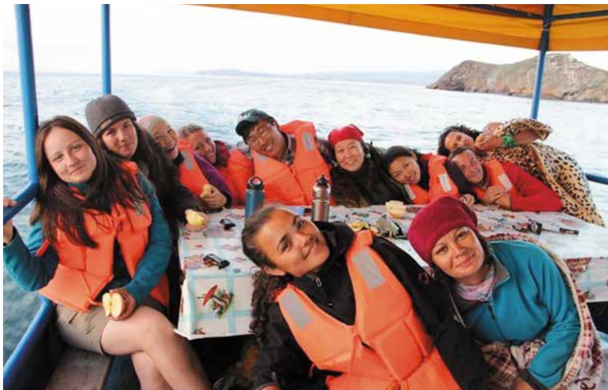
Участники программы 2013 г.

В 2013 г., кроме того, что программа проводилась в штатах Калифорния и Невада, появилась возможность посетить штат Аризона, благодаря встречам, организованным неправительственной организацией «Earth Island Institute». Кроме официальных встреч участники увидели величайшие природные достопримечательности США: Национальный парк «Йосемити» (Yosemite), Национальный парк «Долина Смерти» (Death Valley), Национальный парк «Гранд Каньон» (Grand Canyon).