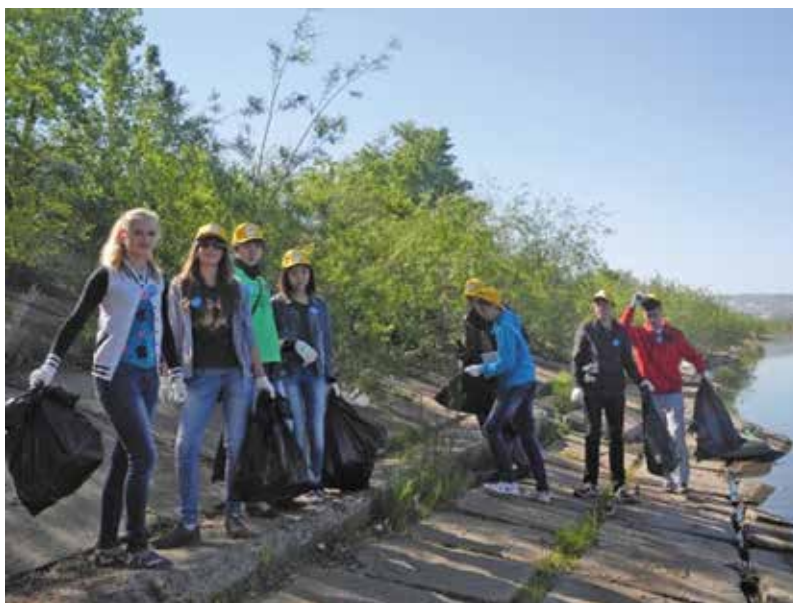
Всероссийская акция «Нашим рекам и озерам — чистые берега»