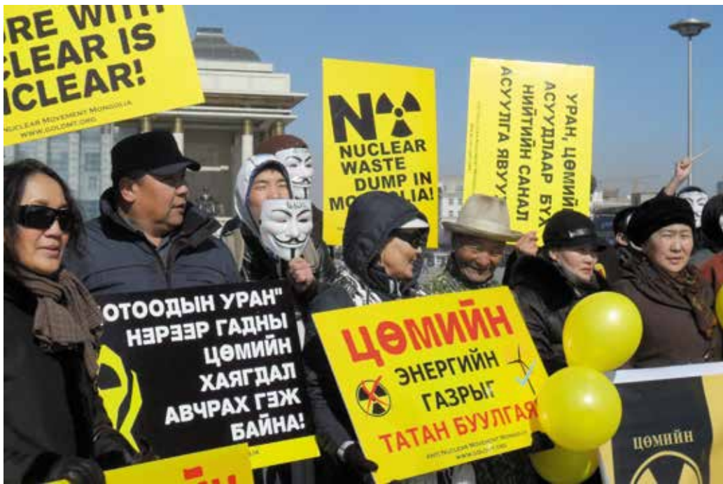
Протест против размещения ядерных отходов на территории Монголии