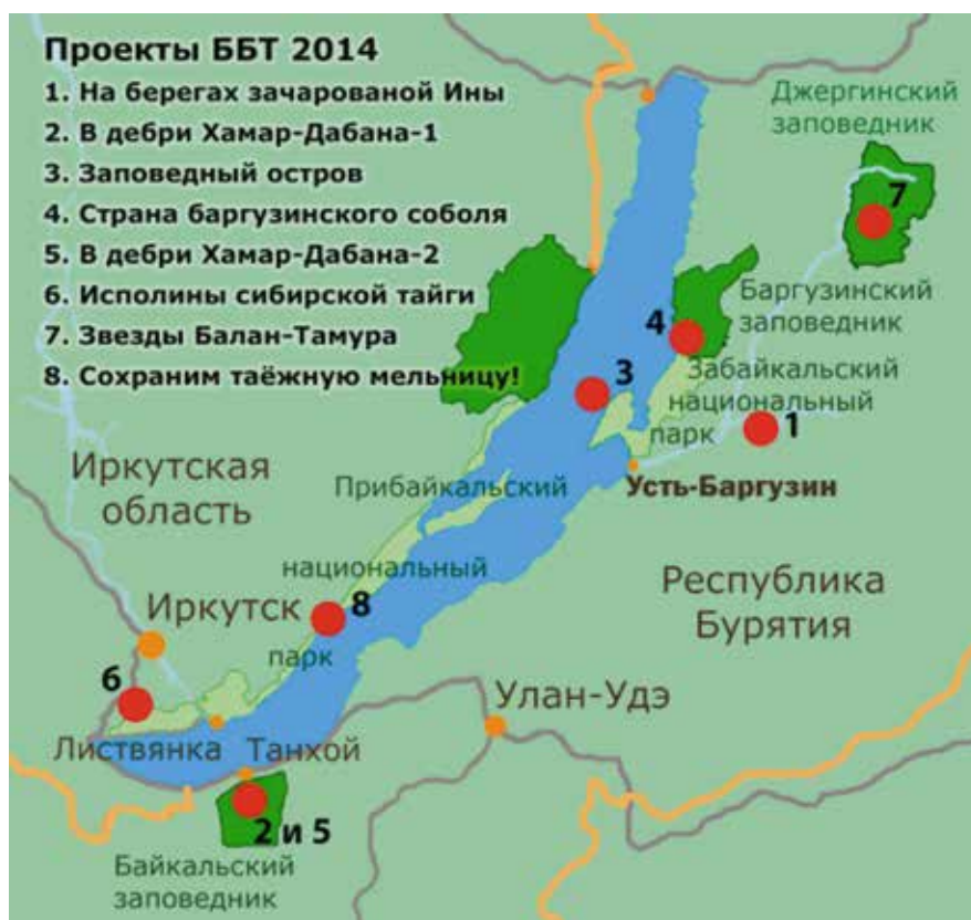
Проекты ББТ 2014 г.

На каждом проекте группу сопровождают бригадир (лидер группы, обладающий знаниями в области строительства троп и организации жизни в полевом лагере) и переводчик, отвечающий за коммуникацию между русскими и иностранными участниками, а также за культурно-развлекательную программу. Официальные языки проектов — русский и английский.