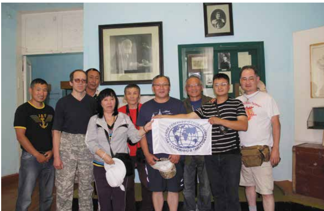
Старт экспедиции «По следам Н.М. Пржевальского» в Кяхтинском музее, 5 августа 2013 г.

отряд прошел в Монголии по следам первой, третьей и четвертой экспедиций Николая Михайловича Пржевальского до границы с Китаем;