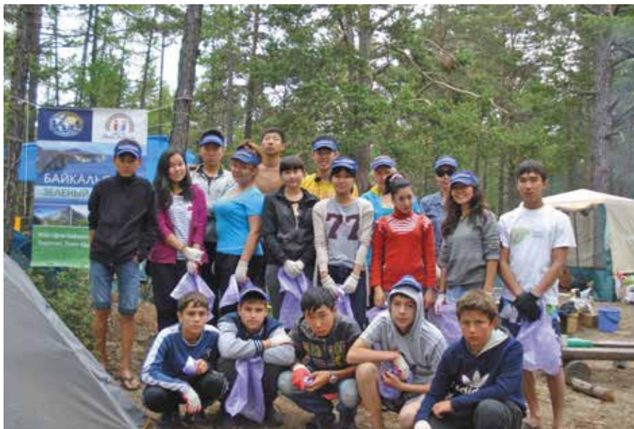
«Байкальский зеленый патруль»