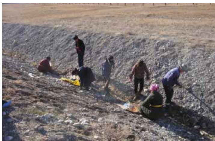
Кампания по сбору мусора на побережье озера Хубсугул