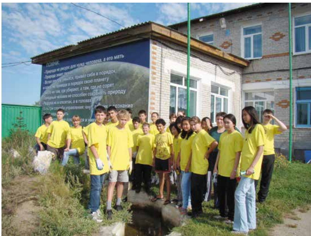
Вторая Байкальская экошкола в МЭОЦ «Истомино», сентябрь 2010 г.

сентябрь 2010 г. и сентябрь 2014 г. — на базе Международного эколого-образовательного центра «Истомино» проведены 1 и 2 и 3-я Байкальская экошкола волонтеров.