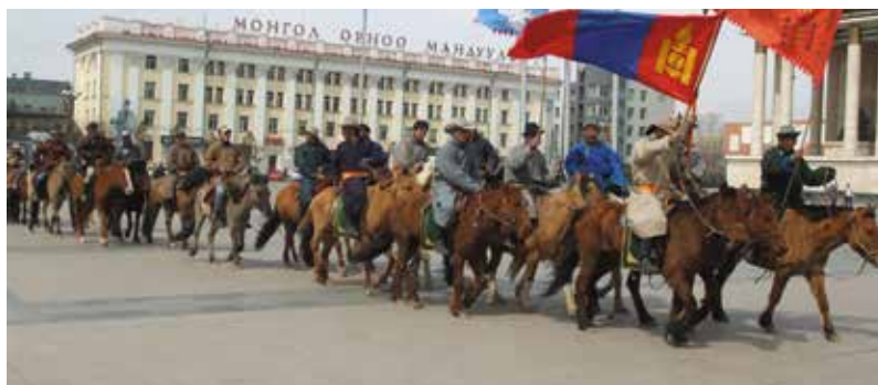
Объединенное движение рек и озер на площади Сухэ-Батора