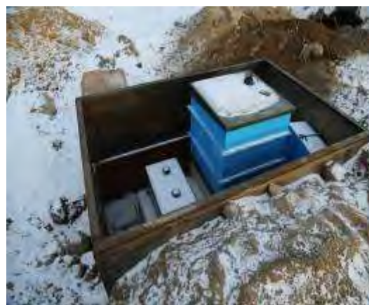
Фото 11 ЛОС в кожухе