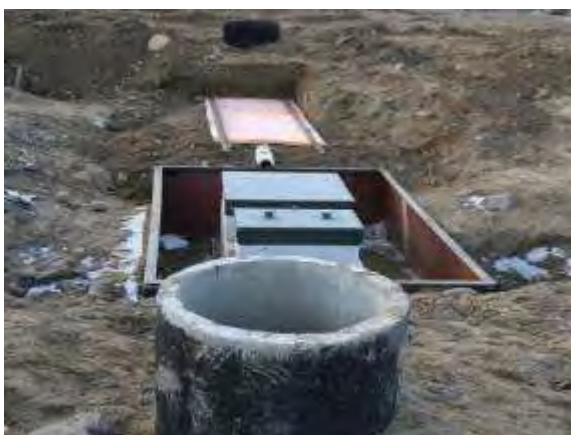
Фото 10 Канализационный колодец подвода системы ТОПАЭРО 9

Представители подрядчика – исполнителя работ провели инструктаж и консультации для работников заповедника, назначенных ответственными за работу очистной станции.