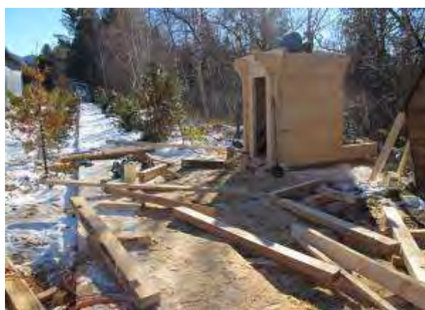
Фото 6 Строительство туалета у начала экологической тропы