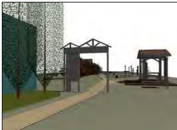
Рис. 2 Экотропа. Входная группа Проект.