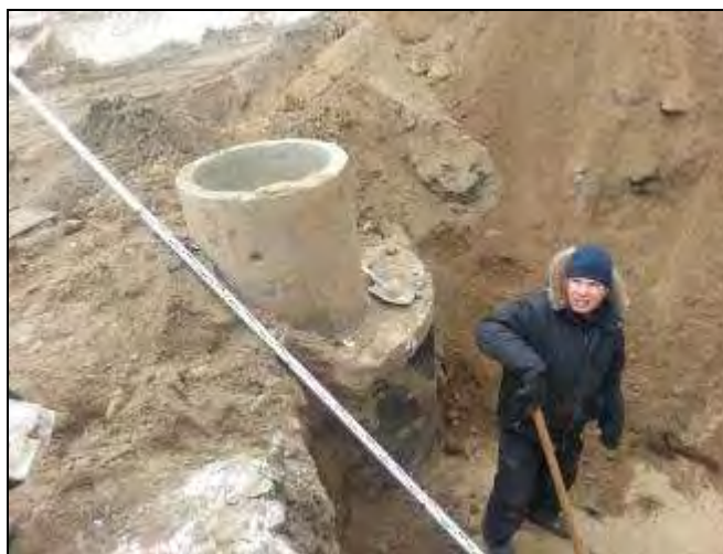
Фото 1 Котлован для локальной очистной станции. Установка колодца