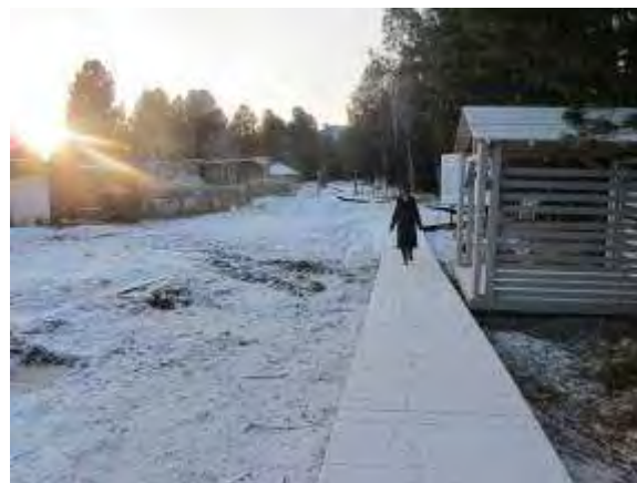
Фото 13 Тропа «Кедровая аллея» готова к приему гостей

Информация о выполнении работ по проекту размещена на сайте Байкальского заповедника, передана на информационные сайты вышестоящей организации (Минприроды России) и сайты партнеров заповедника, а так же информационным порталам. Информационные сообщения доступны на сайтах организаций и информационных агентств (Приложение 5).