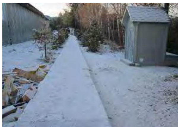
Фото 7 Завершение строительных работ на начальном участке тропы