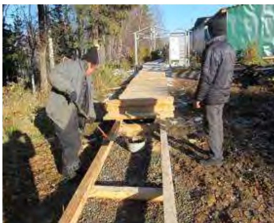
Фото 4 Обработка деревянных конструкций антисептическим составом