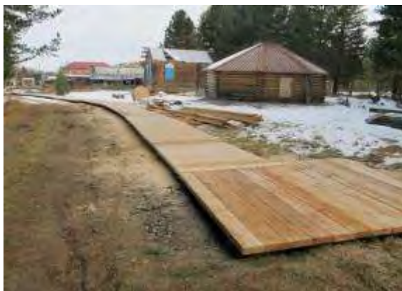
Фото 12 Деревянный настил экологической тропы

Успешная реализация проекта «Расширение экологической тропы «Кедровая аллея» и усовершенствование для нее комплексной ботанической экскурсионной программы в Байкальском государственном природном биосферном заповеднике» обеспечила создание дополнительных объектов познавательного туризма, развиваемого Байкальским заповедником, и поддержание их в состоянии, отвечающем ожиданиям туристов.