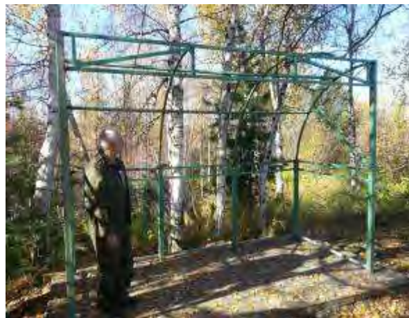
Фото 5 Обустройство места сбора ТБО. Тестовая площадка для селективного сбора мусора