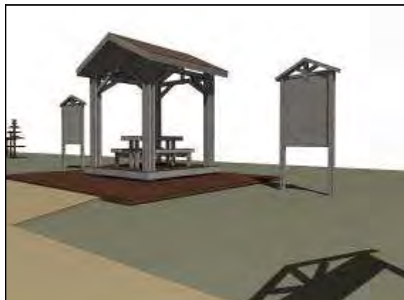
Рис. 3 Экотропа. Информационная беседка. Проект.